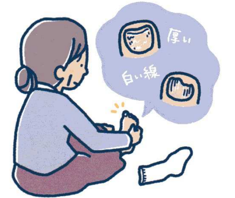
爪が厚くなったり、ポロポロと欠けたりしたら爪白癬かも

爪に痒みや痛みがないため、放置してしまいがちですが放っておくと、変形した爪が足に食い込んで痛んだり、傷をつけたりし、そこからバイ菌が入って二次感染を起こす場合もあるので、爪に異常を感じたら皮膚科を受診しましょう。